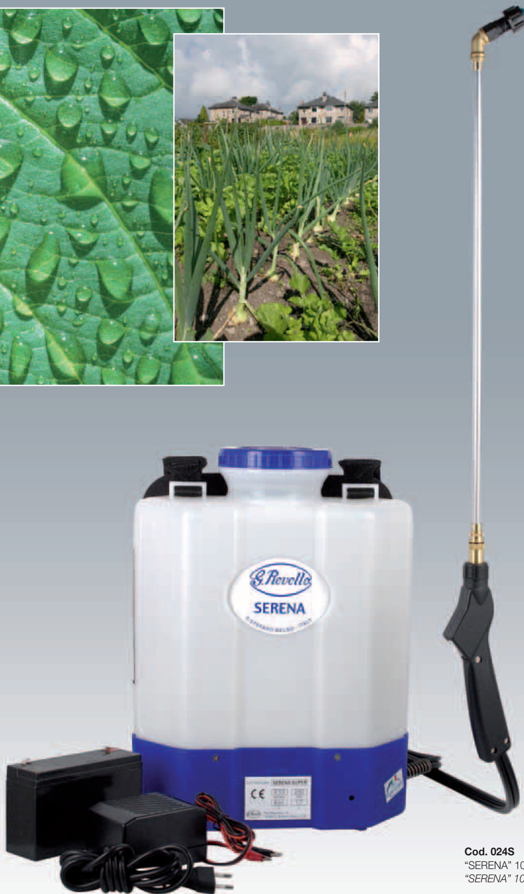
Cod. 024S "SERENA" 10 lt "SERENA" 10 lts