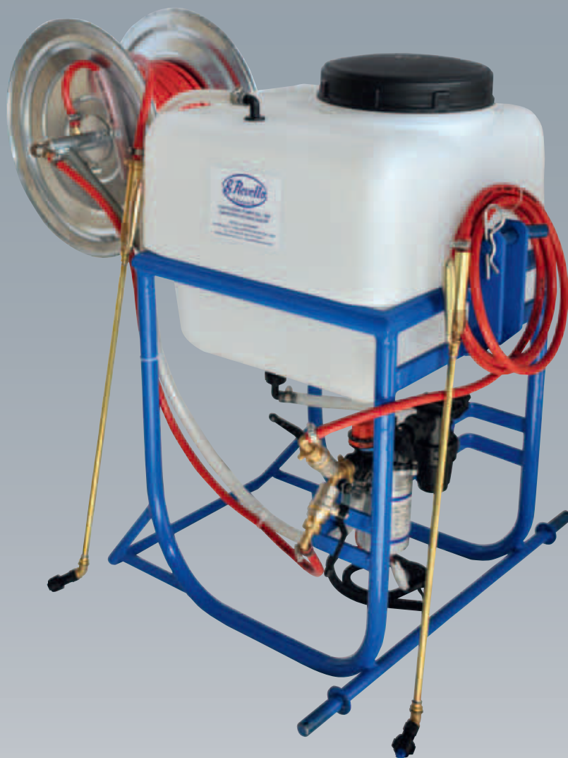
COD. 3100 "REDA" LT50 / 50lts